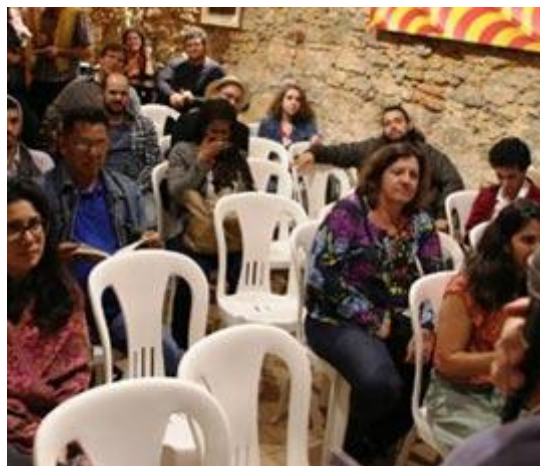
Atividade cultural no RJ visibiliza lutas em defesa das águas