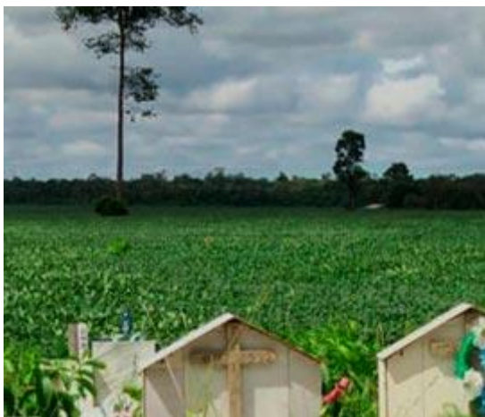
Vídeo mostra destruição causada pela soja no Pará